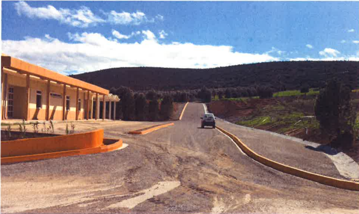
Ρυμοτομικός δρόμος διαχωρισμού ιδιοκτησιών

Επίσης, κατασκευάστηκε το πεζοδρόμιο στην ανατολική πλευρά του Κεντρικού οδικού άξονα πριν την Πύλη εισόδου της ΒΙΠΕ, με κόστος 7.500 ευρώ, ενώ στο Λιμάνι επενδύθηκαν 63.161 ευρώ για αναβάθμιση ανυψωτικών μηχανημάτων και 7.486 ευρώ για την ολοκλήρωση αποκατάστασης του δαπέδου στο Κρηπίδωμα Γ.