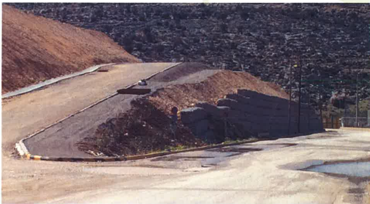
Ενίσχυση πρανούς με τοποθέτηση συρματοκιβωτίων για τη δημιουργία πεζοδρόμου

Μέσα στο 2017 προχώρησαν τα βασικά έργα Υποδομής του Οικοδομικού Τετραγώνου ΟΤ 4 (Β' φάση έργων) που ήταν επιβεβλημένα μετά και την ολοκλήρωση της Πράξης Εφαρμογής του 2014. Η ανάθεση των έργων έγινε μετά από διαγωνισμό στην Τεχνική Εταιρεία ΕΡΓΟΣΤΗΛ ΑΕ αντί προϋπολογισμού 147.500 ευρώ. Το έργο είναι σε εξέλιξη κι έχουν μέχρι 31-12-2017 τιμολογηθεί έργα αξίας 112.000 ευρώ